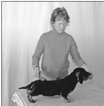
RYSUNEK 6.7. Czesanie szczeniaka na stole