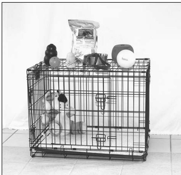
RYSUNEK 6.1. Akcesoria potrzebne przed przybyciem szczenięcia