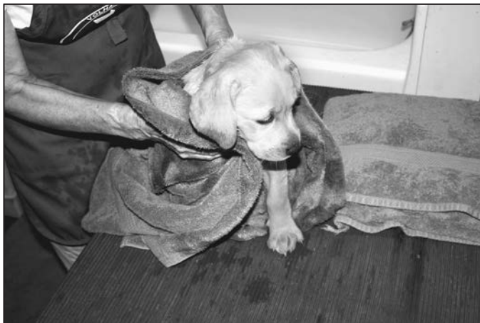
RYSUNEK 6.9. Suszenie szczeniaka po kąpielii